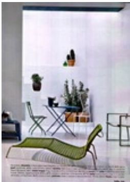
Hearth Home (I)