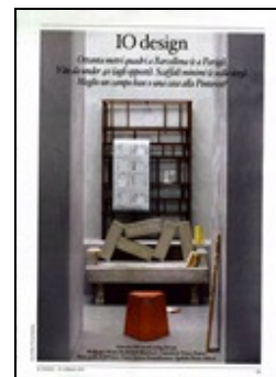
Io Donna (I)