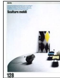
Case da Abitare (I)