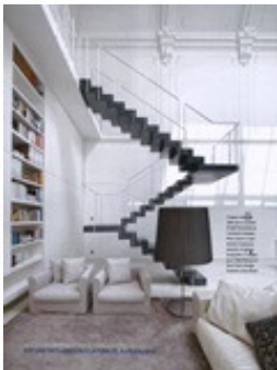
Residence Dec. (NL)