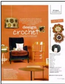
Casa Facile (I)